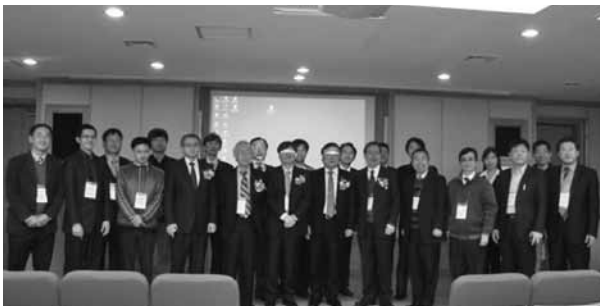
図 2 日本・台湾からの出席者・RESKO 代表による会場での記念撮影

KITECH の Current Status of Wellness Technologies 「ウェルネス技術の現状」には韓国の元気のよいこの分野での発表に非常に興味を持っていたが講演は韓国語であった)。図 2 は日本・台湾からの出席者代表・RESKO 代表による会場での記念撮影である。