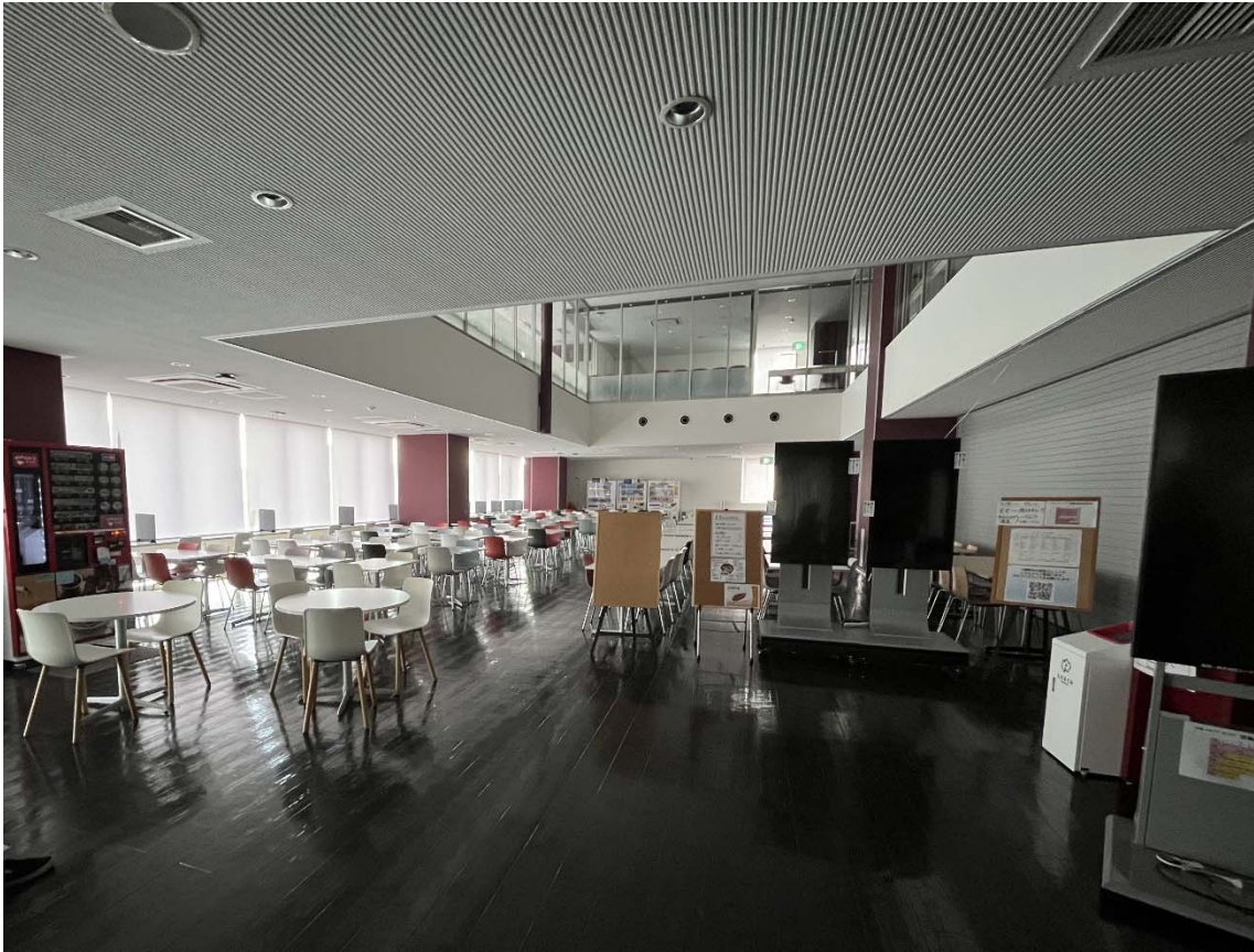
① 東海キャンパス南ウィング1階食堂・売店エリア外観