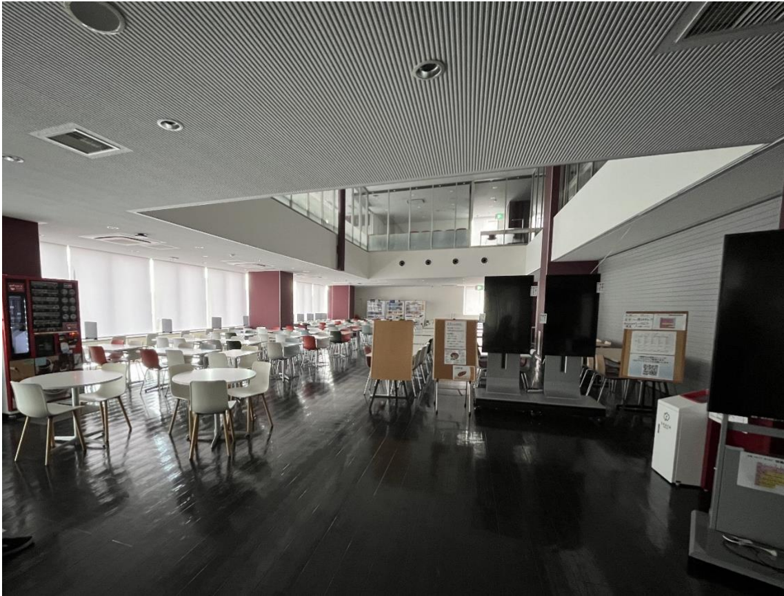
① 東海キャンパス南ウィング1階食堂・売店エリア外観